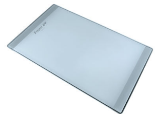
PLANCHE DE DECOUPE CRYSTAL 23x41 CM

* uniquement en combinaison avec l'accessoire A644 F04