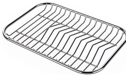
GRILLE PORTE-ASSIETTES INOX 25x35