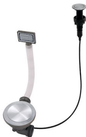
VIDAGE FADE PUSH INOX A407 A16