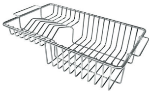
GRILLE PORTE-ASSIETTES INOX 250x425

* uniquement en combinaison avec l'accessoire A644 A01