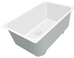
CUVETTE PLASTIQUE BLANCHE

* uniquement en combinaison avec l'accessoire A644 F04