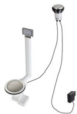
VIDAGE FADE LIGHT A407 A17