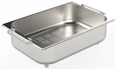
CUVETTE PERFOREE INOX